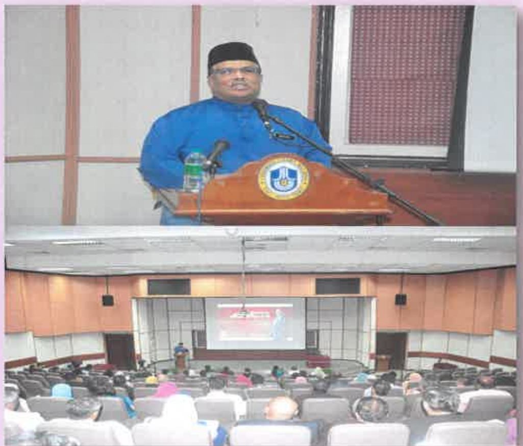
Susana di sekitar berlangsungnya Perjumpaan Naib Canselor Bersama Dekan, Pengarah CoE dan Ketua RU 2017

Sesi perjumpaan ini diadakan sebagai satu platform pertemuan antara Naib Canselor dan semua pihak yang terlibat dengan Pusat Kecemerlangan (CoE) dan Pembangunan (R&D) mengikut bidang tujahan Universiti Utara Malaysia. -UNTUK BERITA PENUH, UHAT MUKA SURAT 4 & 5 Idea tentang halatuju CoE supaya perkembangannya selaras dengan hasrat penubuhan CoE iaitu membudayakan dan meningkatkan kualiti